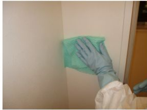
• ブース内照明スイッチ