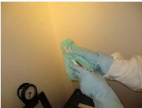
• ブース内リモコン