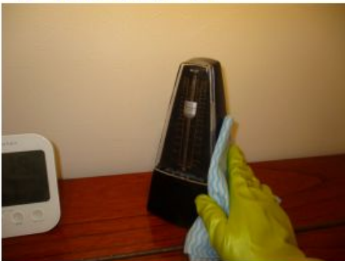
• ブース内メトロノーム