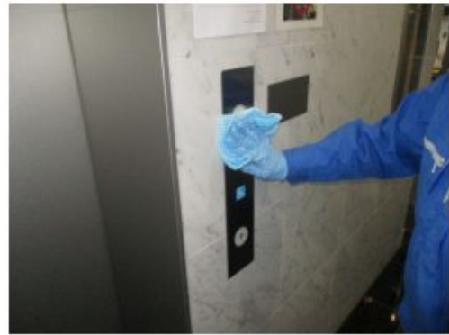
• 1F エレベーターホールボタン