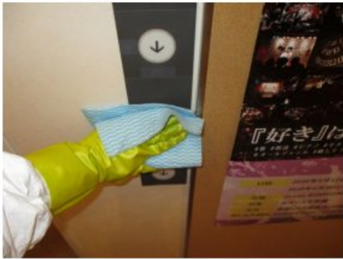
• 4F エレベーターボタン