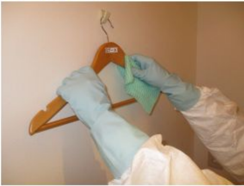
• ブース内ハンガー