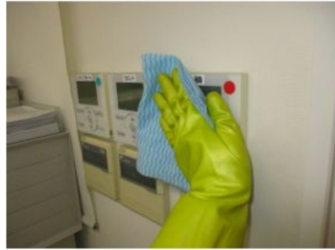
• コントロールパネル